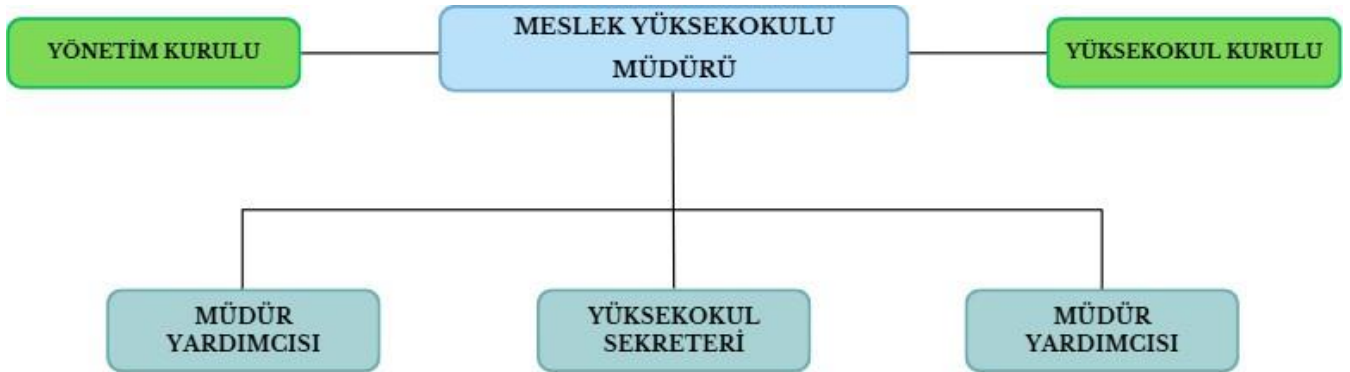
Şekil 2- İdari Teşkilat Şeması

Meslek Yüksekokulumuzda idari teşkilat yapısı Meslek Yüksekokulu Müdürlüğü bünyesinde Okul Müdürü, Yönetim Kurulu, Yüksekokul Kurulu, Yüksekokul Sekreteri ve Müdür Yardımcılarından oluşmaktadır.